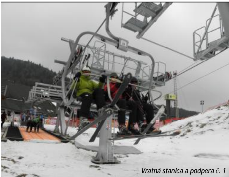
Vratná stanica a podpera č. 1

Stacja Narciarska Jaworzyna Krynicka S.A. Poland